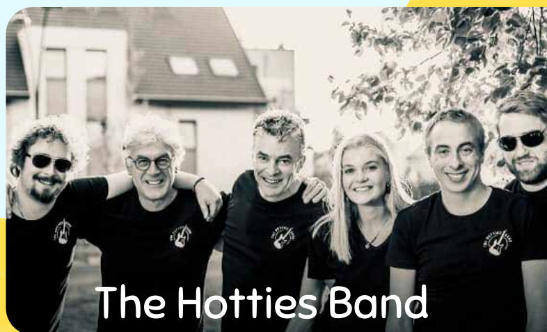
The Hotties Band

Organisatie Lokaal Bestuur Alveringem Onderhevig aan de actuele coronamaatregelen