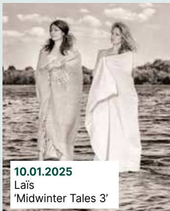
10.01.2025 Laïs 'Midwinter Tales 3'